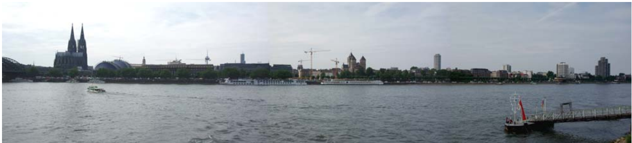
Blick von der "schäl Sick" auf das Planungsgebiet

Im Rahmen eines umfangreichen Hochwasserschutzprogrammes wird der Schutz gegen Überflutungen für großräumige Bereiche des Kölner Stadtgebietes verbessert.