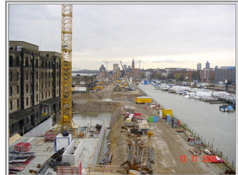
Baustelle bei Hochwasser des Rheins

Der in der Innenstadt von Köln gelegene Rheinauhafen wird im Zuge einer städtebaulichen Gesamtentwicklung aus seiner bisherigen gewerblichen Nutzung in eine Fläche mit einer Nutzungsmischung aus Handel, Dienstleistung, Wohnen und Kultur umgewandelt. Das überplante Gebiet erstreckt sich entlang des linken Rheinuferes über eine Länge von etwa 2 km zwischen dem vorhandenen Schokoladenmuseum und der Südbrücke.