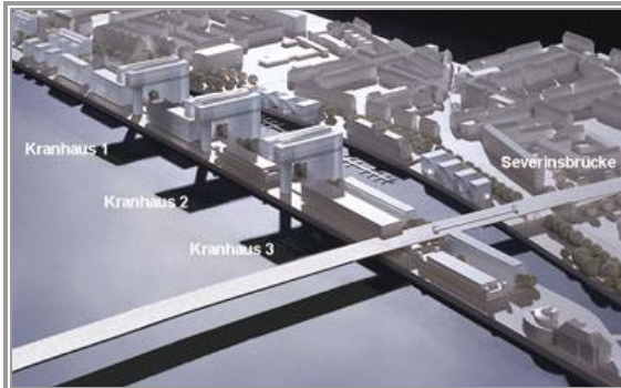
Modell der Bebauung