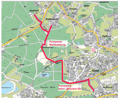
Übersicht der Gesamtmaßnahme