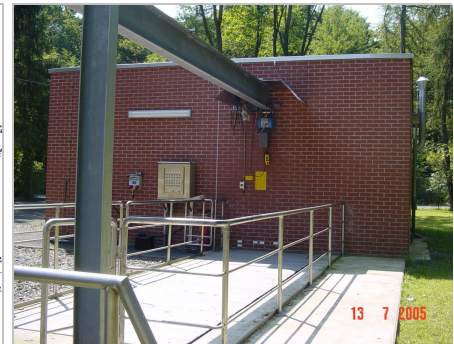
Pumpwerk Waldsiedlung Heidgen

Im Zuge einer strukturellen Änderung der Abwasserbehandlung werden Teilflächen des Stadtgebietes einer anderen Kläranlage zugeordnet. Zur Umsetzung des Gesamtzieles sind mehrere funktionell miteinander verknüpften Baumaßnahmen erforderlich. Die Gesamtmaßnahme teilt sich in folgende Baulose auf: